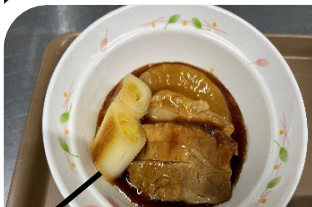
あんこうに負けず好評だった豚角煮

正月の和生菓子は「うぐいす」でした。「めんこいじゃ」と皆様にとりこりしていました。