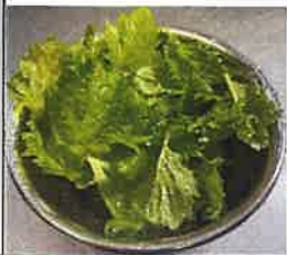
収穫したての大葉

春から始めたささえの菜園の野菜も収穫されるようになってきました。獲れたての二十日大根は新鮮で彩りも良く、サラダにしたら皆さん喜んで食べられていました。収穫された大葉も茄子と味噌炒めにして「香り良く美味しい」「爽やかでさっぱりする」と言っていただけでいます。他にも収穫した茄子を焼き茄子にしたり、ほうれん草は煮魚の付け合わせにするなど旬の味を皆さんに味わっていただいています。